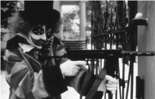
Die dritte Generation von Rainer Werner Fassbinder