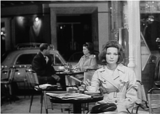
L'Ainé de Ferchaux von Jean-Pierre Melville