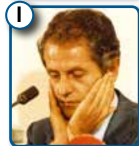
I Uwe Barschel Ministerpräsident SH