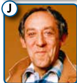
J Dieter Hallervorden Kabarettist