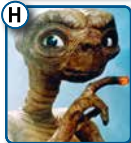
H E.T. Außerirdischer