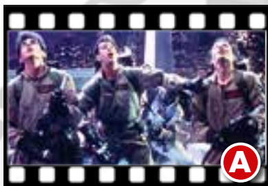
Harold Ramis, Bill Murray und Dan Aykroyd und räumen ordentlich auf.