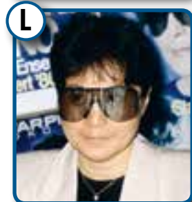
L Yoko Ono Künstlerin