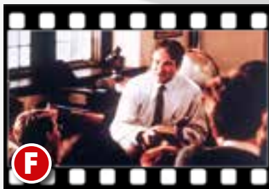
Robin Williams begeistert als Lehrer seine Schüler für die schönen Künste.