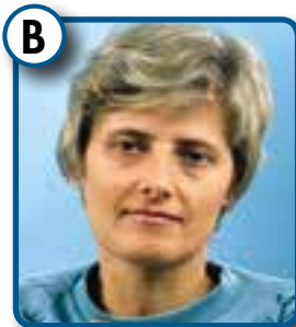
B Petra Kelly Grünen-Politikerin