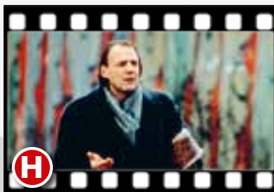
Bruno Ganz in einer Glanzrolle unter der Regie von Wim Wenders.