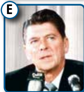
E Ronald Reagan US-Präsident