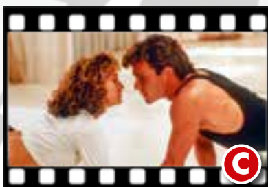
Jennifer Grey und Patrick Swayze kommen sich näher.