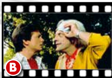
Neugieriger Teenager und verrückter Professor: Michael J. Fox und Christopher Lloyd.