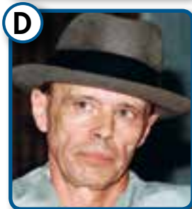
D Joseph Beuys Künstler