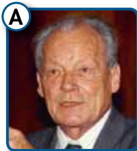
A Willy Brandt Ehrevorsitzender SPD