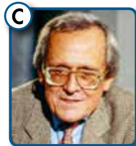
C Dieter Hildebrandt Kabarettist