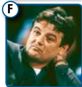
F Joschka Fischer Grünen-Politiker