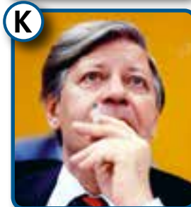
K Helmut Schmidt Bundeskanzler