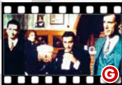
Epochenfilm mit Robert de Niro (M.) als „Noodles“; Regie: Sergio Leone.