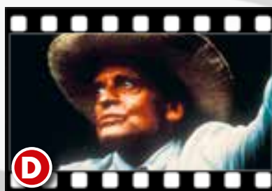
Klaus Kinski, durchgeknallt wie häufig, will im Dschungel ein Opernhaus bauen.