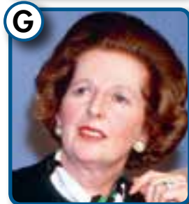
G Margaret Thatcher UK-Premierministerin