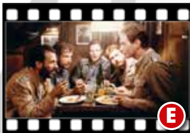
Henkersmahlzeit? Jürgen Prochnow (2. v. l.) muss mit seinem Team durch die Hölle.