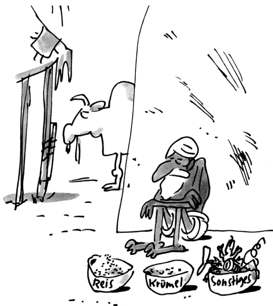
- Rhavi Khali Kutta - Der Erfinder der Trennkost

men Kernspin-Tomografen lässt man sich lieber warmes Öl auf die Stirn gießen, damit die ausgebrannten Hirnzellen darunter auch noch für die nebulösesten Botschaften empfänglich werden. Das Ganze garniert mit ein wenig Weihrauch, einer Messerspitze Hindu und einem Teelöffel Hare Krishna, und die gebeutelten Seelen des teuflisch-kapitalistischen Systems werden zumindest in ihrer esoterischen Abgeschiedenheit zur Erleuchtung gelangen. Wer in diese Sphären abgedriftet ist, braucht auch nicht mehr zu realisieren, dass Ayurveda der Exportschlager der indischen Medizinindustrie ist.