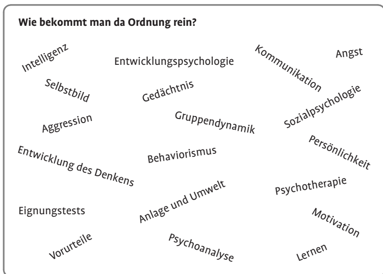
Tafel 4: Stichwörter zu einigen Themen der Psychologie – eine unübersichtliche Sammlung, sofern man nicht über Ordnungskriterien verfügt.

klar geordnet sein. Doch mehrere Themen scheinen in zufälligen Relationen, sozusagen »kreuz und quer« zueinander zu stehen.