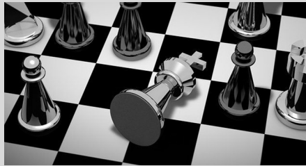
Abb. 1: Schachspiel

Die internationale Politik wird oft mit einem Schachspiel verglichen. Die Akteure kämpfen erbittert um kleine und große Vorteile, offene und verborgene Tricks werden angewandt, langfristige Strategien und kurzfristige Taktiken umgesetzt, und am Schluss endet der Kampf mit Sieg, Niederlage oder einem Patt zwischen den Kontrahenten. Die Komplexität der Abläufe erfordert Kaltblütigkeit und große Erfahrung, und bis in das 20. Jahrhundert hinein, galten Staatsmänner wie Henry Kissinger als Meister des diplomatischen Spiels auf der Weltbühne. Die globale Politik (und damit auch ihre Analyse) funktioniert allerdings ohne die klaren Regeln, die bestechende Logik und die (je nach eigener Genialität) bis zu einem gewissen Grad vorhersehbaren Abläufe im Schach, so dass den Vergleichen Grenzen gesetzt sind. Zudem ist die Zahl der Spieler in der globalen Politik viel höher, und die Ergebnisse können alle möglichen Abstufungen zwischen Gewinn und Verlust sein. Dennoch ist der Vergleich mit Schach nützlich, und zwar im Hinblick auf das Studium der IB.